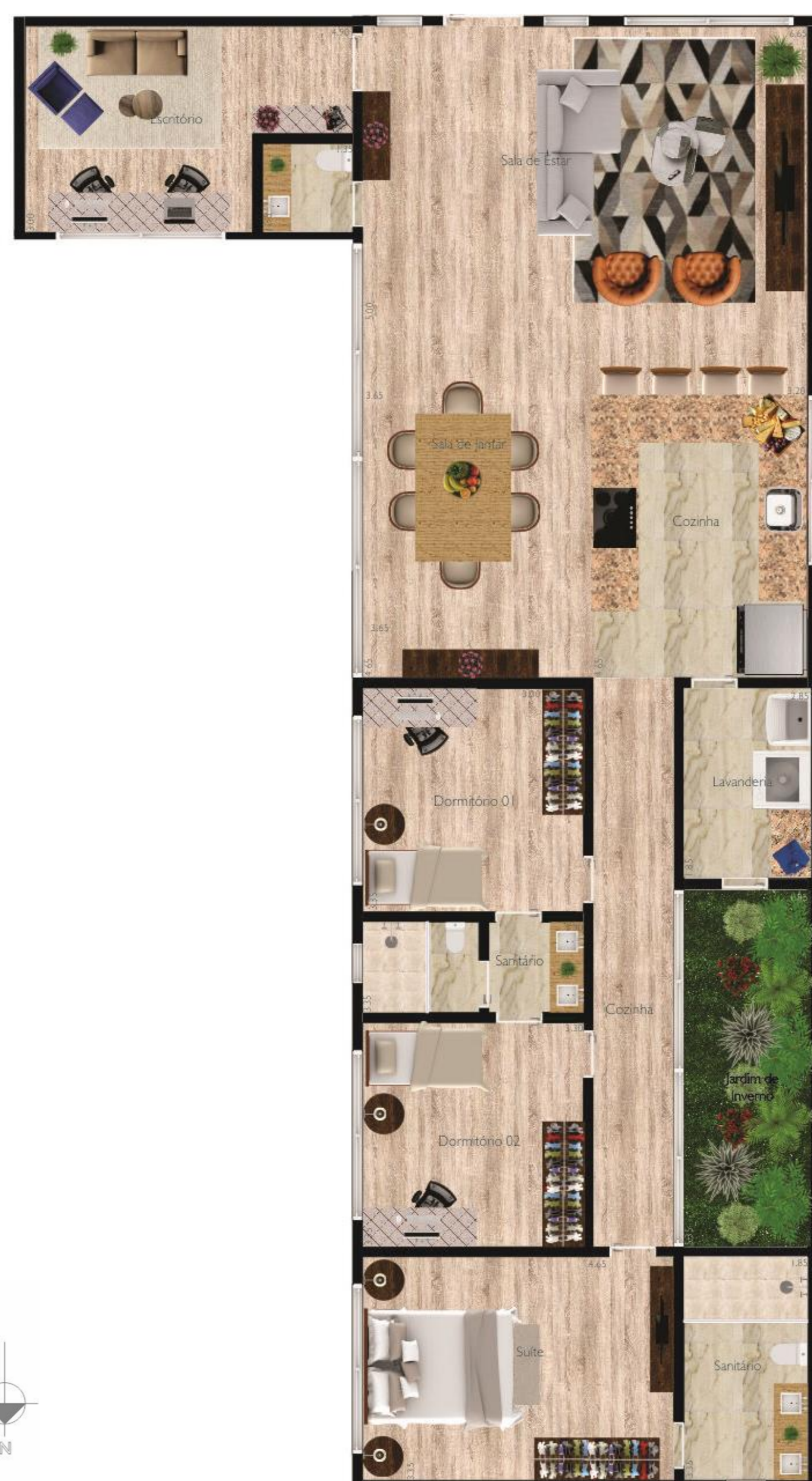
Planta Baixa Layout Esc. 1/75